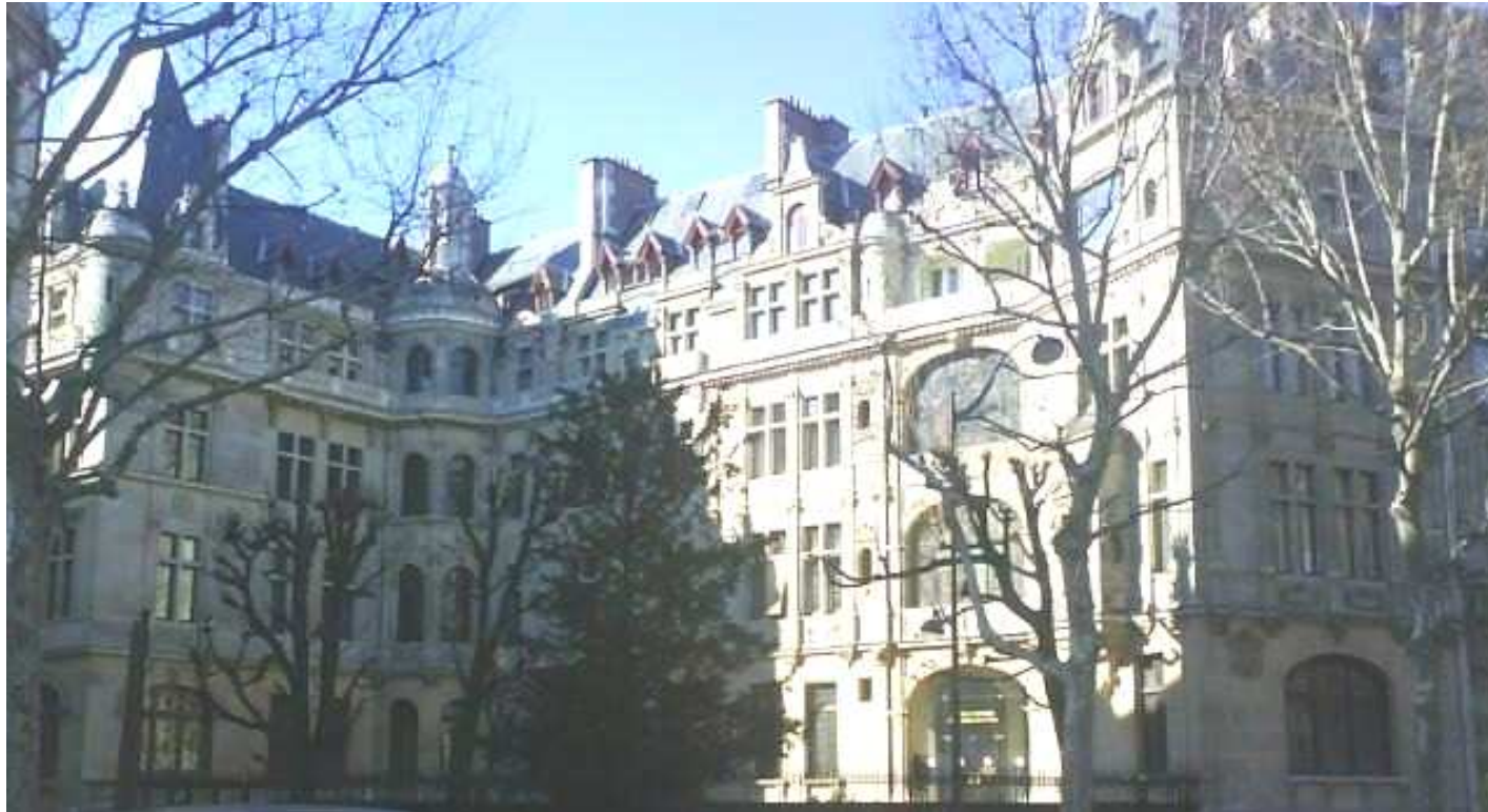
215 Boulevard Saint Germain